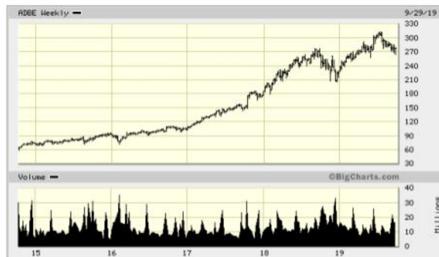
Adobe Inc. - grafic pret actiuni ultimii 5 ani

Segmentul Experiență Digitală este unul în creștere pentru companie și oferă soluții de creare, gestionare, executare, măsurare și optimizare de materiale de marketing și publicitate digitală. Segmentul de Publicare este o afacere moștenită.