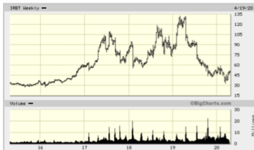
iRobot Corporation - pret actiuni ultimii 5 ani

Astăzi, iRobot este un lider la nivel mondial în domeniul roboților pentru consumatori cu 30 de milioane de roboți vânduți în toată lumea. Compania a dezvoltat unii dintre cei mai importanți roboți din lume și are o istorie plină de inovații. iRobot Corporation are sediul central în Bedford, Massachusetts.